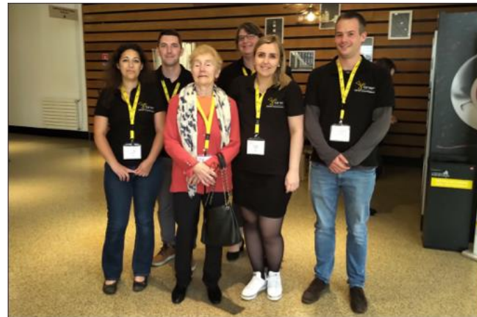
Rencontre avec Hélène Langevin-Joliot lors du congrès national - Juin 2019