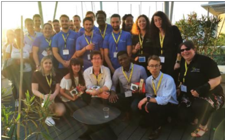
Soirée jeunes « Curie Game » lors du congrès national - Juin 2019