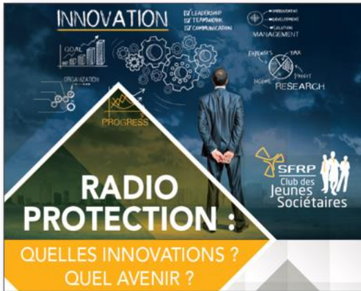
Organisation d'un congrès sur le thème des innovations en radioprotection – Avril 2018