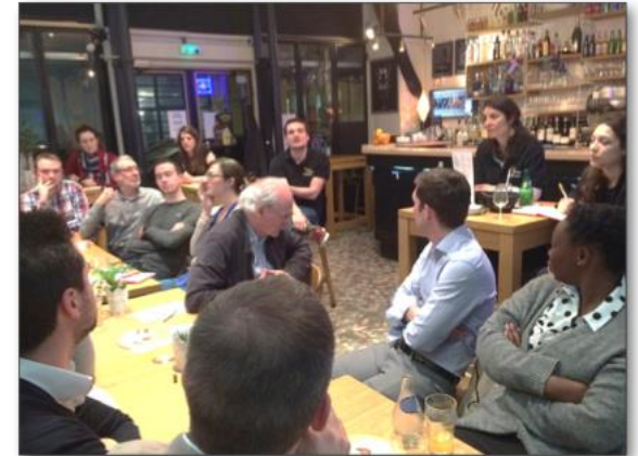
Organisation d'un « Afterwork » sur le thème de l'éthique en radioprotection – Mars 2019